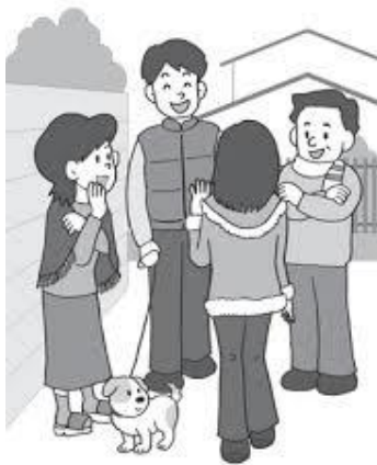
将来に負担を残したくない！ みんなで使える施設にできる？

全体を一読して感じたことですが、どうも、いつもの市長の語調とは違っているように感じました。誰か他の人の基本文に手を入れたような、違っていたらご容赦願います。これまででは、もっと味があつたように感じましたものですか。この回答文は、やや機械的事実の羅列になっています。一般市民には、もっと具体的で丁寧な説明が大事かと思えます。